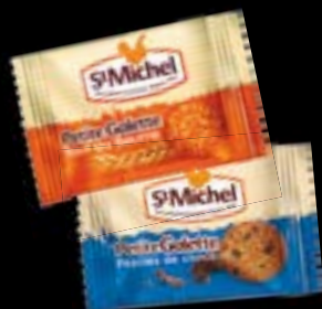
79486 Petites galettes St Michel Pur Beurre 79415 Petites galettes St Michel Pépites de chocolat Boite de 400 pièces 19,60 € ht la boîte 0,049 € ht la pièce