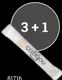
81716 Sucré buchette Boite de 2 kg