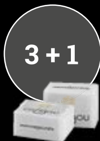
81715 Sucré 2 morceaux Boite de 4,75 kg