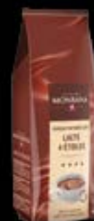
78880 Chocolat Lacté Sachet de 1 kg