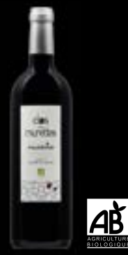
79618 Faugères Clos des Murettes Ollier Taillefer TG : 6,72 € HT Prix promo : 5,60 € HT