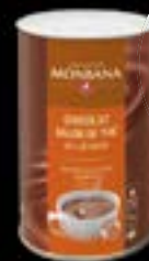
77204 Chocolat non Lacté Sachet de 1 kg