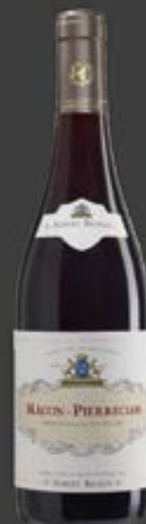
79661 Mâcon Pierreclos Albert Bichot TG : 8,80 € HT Prix promo : 7,33 € HT