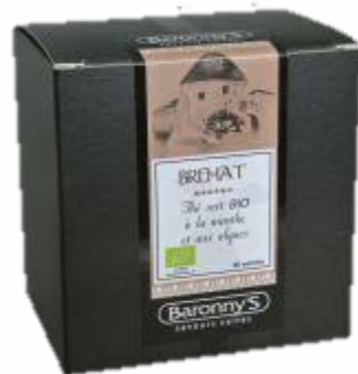
— BREHAT —

Agréable, doux et frais à l'image de son île, ce thé vert est excellent et laisse une belle saveur de chlorophylle en bouche. Belle association avec un mélange de 3 algues (laitue, dulse et nori). Ce mélange est certifié Bio.