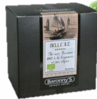
— BELLE ÎLE —

Une composition harmonieuse d'arabicas raffinés issus de la culture écologique, caractérisée par son goût fin et aromatique. La culture et la préparation ont lieu selon des normes écologiques sévères. Cela permet de protéger la nature et de sauvegarder l'avenir économique des caféiculteurs.