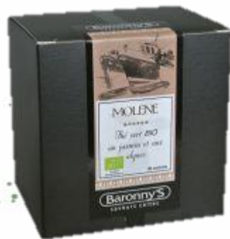
— MOLENE —

A la fois douces et subtiles, les essences du jasmin viennent s'associer judicieusement aux effluves iodées des algues de notre recette « MOLENE ». Un thé riche en antioxydants qui nous dévoile un souffle marin sur une saveur fleurie et gracieuse. Cette recette est certifiée Bio.