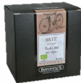
— BATZ —

Une invitation à l'exotisme avec les 7 îles. Magnifique thé vert Sencha Bio aux notes sucrées d'ananas et de vanille, coloré par de lumineuses pétales de fleurs.